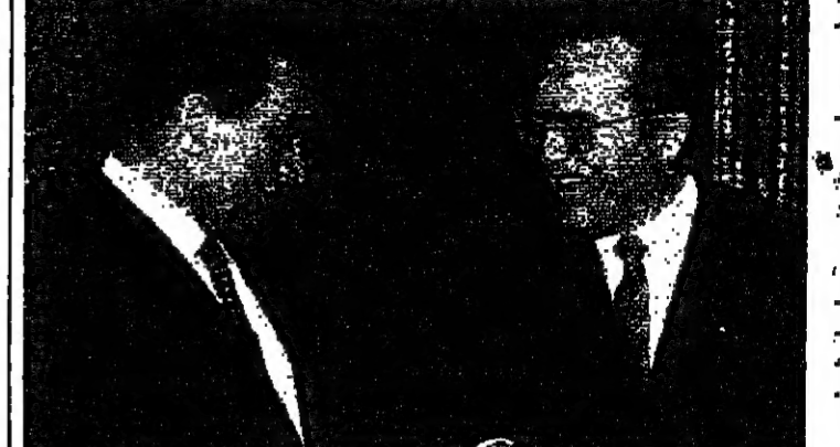
مارتنز خلال مقابلة مبارك

قال رئيس الوزراء البلجيكي والفردين مارتنز للرئيس المصري حسني مبارك امس ان مساندة القاهرة لمسعى تقوم به المجموعة الأوروبية لاجل السلام في الشرق الاوسط ستشجعها على الاستمرار في جهودها. وشرح السيد مارتنز بذلك اثناء حديثه في مائدة عشاء، اقيمت تكريما للرئيس مبارك، الذي وصل بيروت امس، في مساهمة لرحلة اوروبية، تستغرق تسعة ايام، يتوقف ان بحث خلالها الرئيس المصري أوروبا على لقب